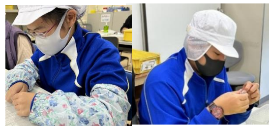
かまいしワーク・ステーション