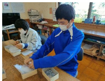
夢工房・カトレア